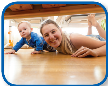
Over and Under 6-12 months