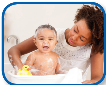
Mojado y seco De 3 a 12 meses