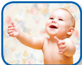
Para arriba y para abajo De 0 a 12 meses