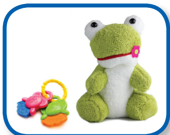
Duro y suave De 6 a 12 meses